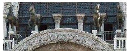
Die Pferde am Dom San Marco in Venedig

Es handelt sich um Beutestücke aus Byzanz aus dem Vierten Kreuzzug. Heute stehen die Originale im Museum