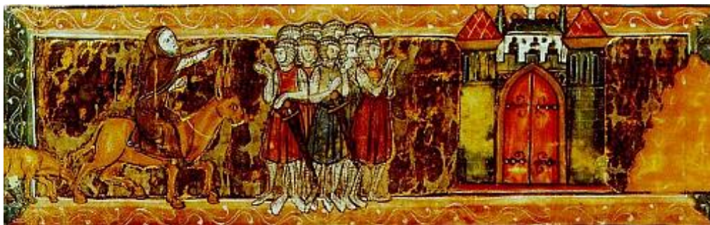
Peter der Einsiedler, ein Anführer einer Kreuzfahrergruppe, weist den Kreuzfahrern den Weg nach Jerusalem. Französische Darstellung von 1270

Der päpstliche Aufruf war beim französischen Adel, im Rheinland und in Süditalien über Erwarten erfolgreich. Es bildeten sich zwei Gruppierungen: der Armenkreuzzug und der Ritterkreuzzug. Beide strebten über Konstantinopel nach Jerusalem, auf ganz verschiedenen Wegen, wie die Karte zeigt.