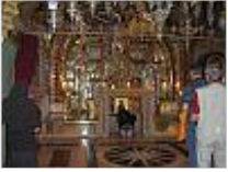
Bild 1: Grabeskirche in Jerusalem: orthodoxe Golgatha- Kapelle . Unter dem Altar markiert eine Silberplatte den angeblichen Standort des Kreuzes Jesu. Man kann den Felsen durch ein Loch in der Platte berühren.