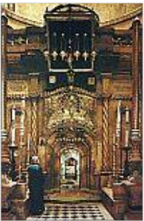
Bild 3: Grabeskirche in Jerusalem: Grabkapelle über dem angeblichen Grab Jesu. "Er ist nicht hier, sondern er ist auferstanden." (Lk 24,6)

Bild 2: Grabeskirche in Jerusalem: Salbungsstein , wo Jesus nach seiner Kreuzabnahme gesalbt worden sein soll.