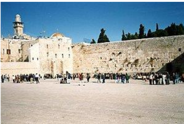
Jerusalem: Klagemauer – Hauptheiligtum der Juden