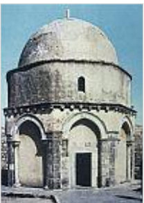
Bild 5: Jerusalem: Himmelfahrtskirche . Von hier aus soll Jesus gen Himmel gefahren sein.

Bild 4: Jerusalem: Via Dolorosa . Rechts im Bild: Kirche am Ort der Gerichtsverhandlung Jesu