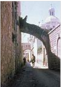
Bild 4: Jerusalem: Via Dolorosa . Rechts im Bild: Kirche am Ort der Gerichtsverhandlung Jesu

Bild 3: Grabeskirche in Jerusalem: Grabkapelle über dem angeblichen Grab Jesu. "Er ist nicht hier, sondern er ist auferstanden." (Lk 24,6)