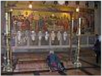
Bild 2: Grabeskirche in Jerusalem: Salbungsstein , wo Jesus nach seiner Kreuzabnahme gesalbt worden sein soll.

Bild 1: Grabeskirche in Jerusalem: orthodoxe Golgatha- Kapelle . Unter dem Altar markiert eine Silberplatte den angeblichen Standort des Kreuzes Jesu. Man kann den Felsen durch ein Loch in der Platte berühren.